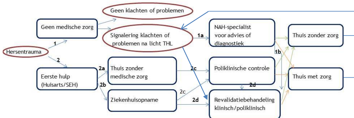
Figuur 3: Routes en transitie na licht THL