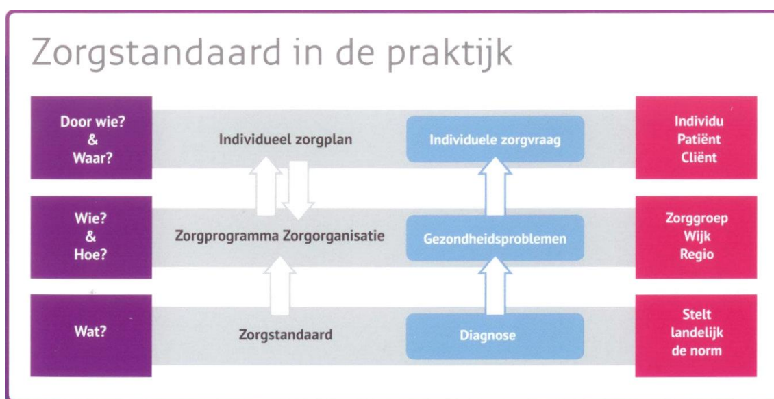
Figuur 1. Zorgstandaard in de praktijk

Figuur 1 verheldert het niveau waarop de zorgstandaard zich bevindt.